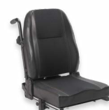
2111 + 2142 + 2173